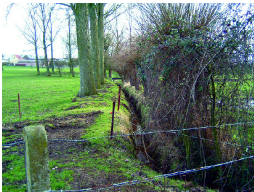
De Bosbeek, de vroegere Larebeek, niet ver van zijn bron.

Zij vertrekt in rechte lijn van de dorpskom naar Lennik en loopt over Gaasbeek naar Brussel. Volgens Verbesselt zou de benaming "Brusselstraat" uit een latere tijd dateren nl. bij het ontstaan van de steden. In de vroegere Frankische periode had de verbinding met Brussel inderdaad geen zin maar was het wel heel logisch Leerbeek te verbinden met Lennik, de hoofdplaats van het gewest.