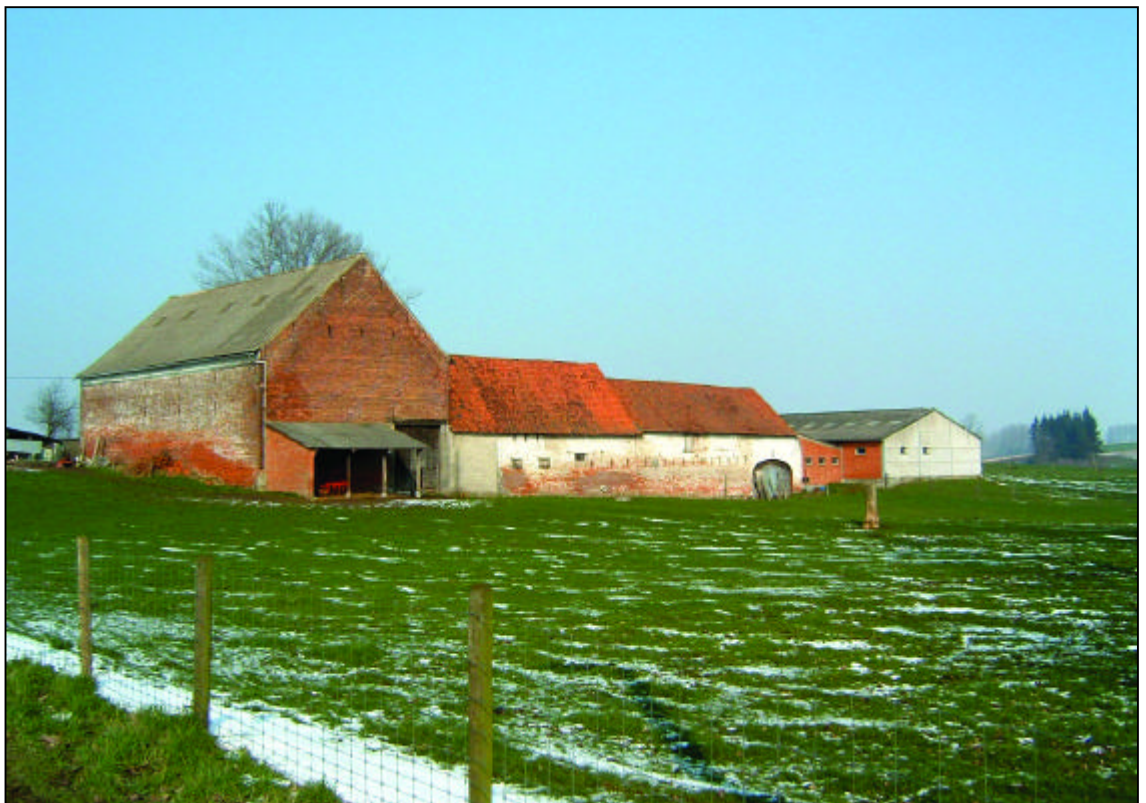
Schitterend "Hof te Putbeek" met verluchtigingsgaten in de schuur.