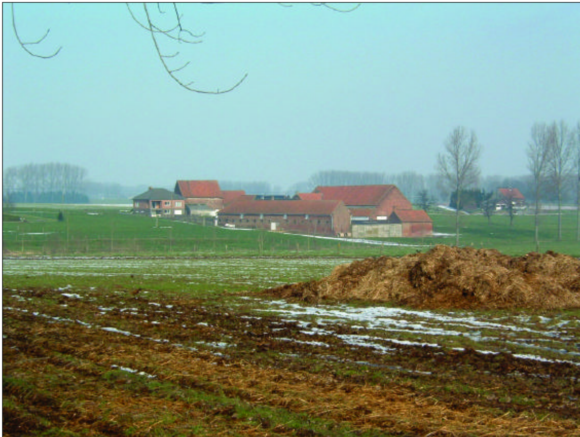
Het "Verbrand Hof" gezien van op de oude weg Halle-Gooik.

Gelegen in de vallei van de Bosbeek. Een mooie vierkantshoeve uit de 18 de -19 de eeuw met een complexe plattegrond en klokje op zadeldak (roepklokje). Langschuur met het jaartal 1869. Eigenaar: familie Schoriels.