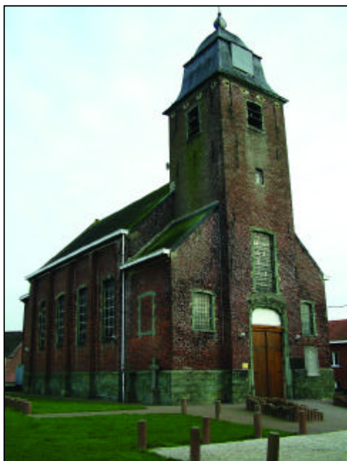
Een poëtisch beeld van de parochiekerk.

De goed ontwaterde lemen heuvelruggen daarentegen vormen een aaneengesloten geheel van open akkers , zonder noemenswaardige begroeiing langs de perceelsgrenzen.