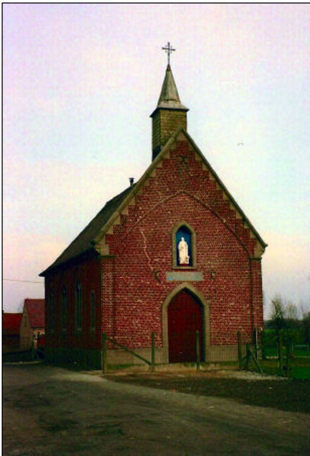
Een typisch beeld is de kapel van de Stevenisten, te vinden in het centrum van Leerbeek.